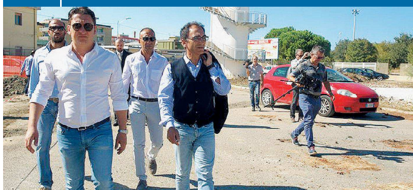
La verifica. Il sindaco Sergio Abramo assieme a tecnici e titolari delle ditte appaltatrici nell'area "Magna Grecia" di Lido dove sono in corso i lavori

Catanzaro Il sindaco verifica lo stato dei lavori che termineranno fra un anno