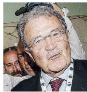
Romano Prodi. «Si mischiano "ius soli" e profughi: sono cose diverse»